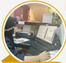
Hotel Darmanusantara Maros