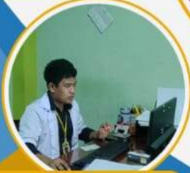
Hotel Darmanusantara Maros